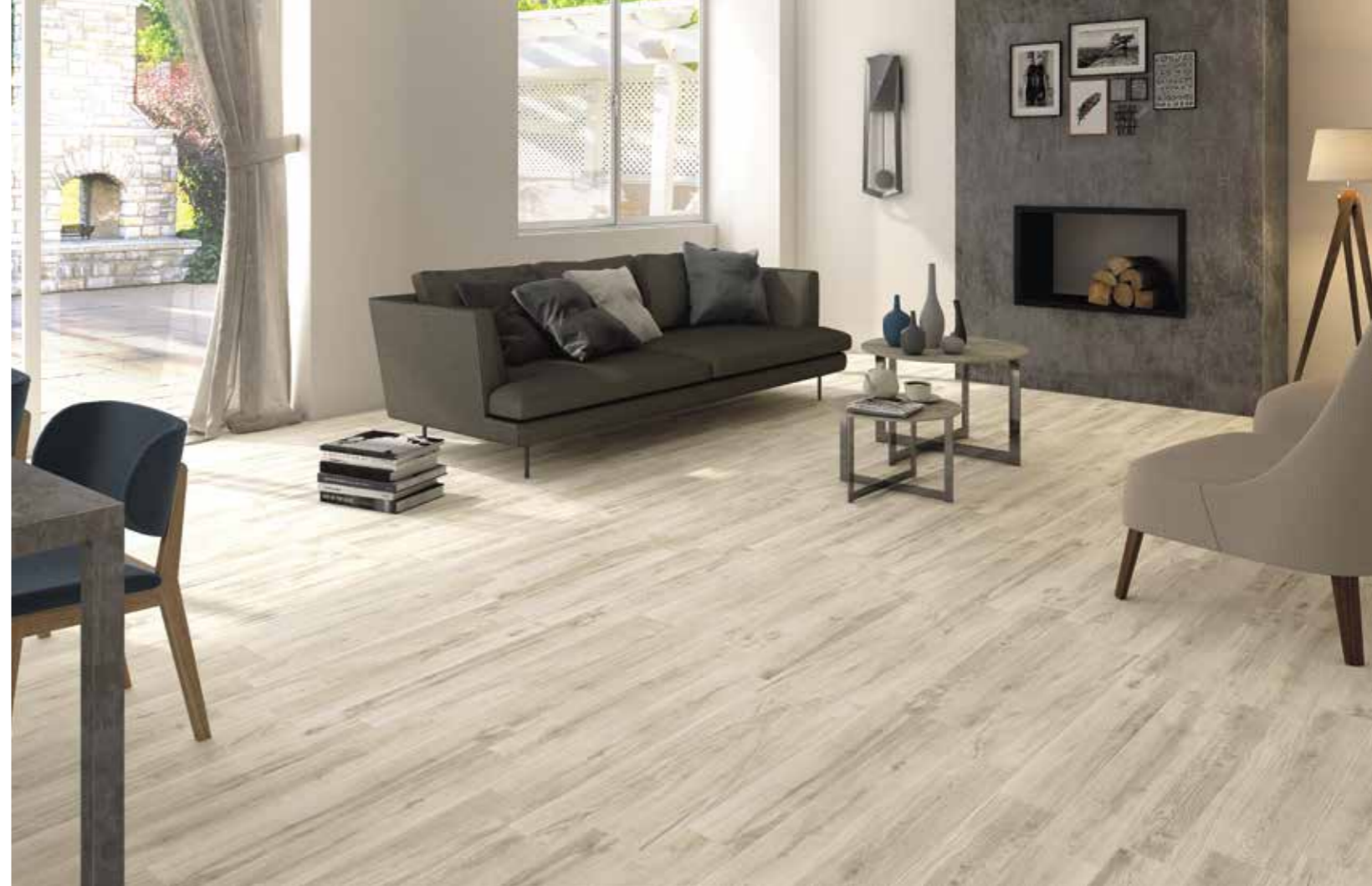
ALMOND 14x84 6"x33"

Nuance e venature caratterizzano questa collezione di ispirazione naturale. I listelli sbiancati, il caldo noce fino ai più freddi mandorla e grigio racchiudono l'essenza dell'eleganza e del calore che la natura sa esprimere.