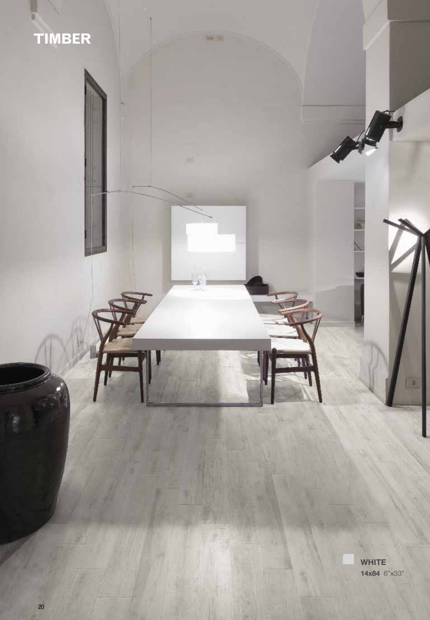
WHITE 14x84 6"x33"