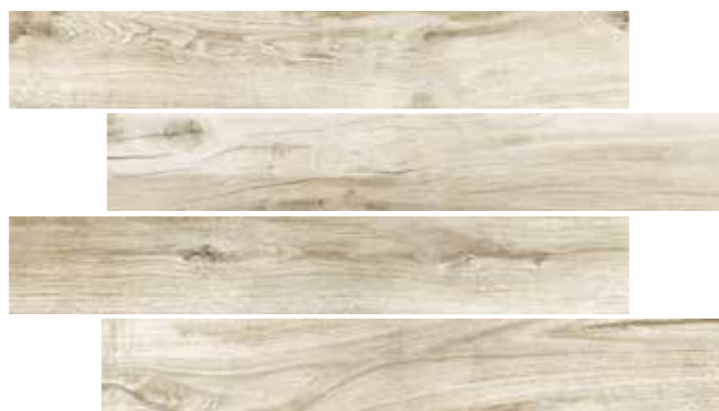
A51 0688245 Almond 14x84 . 6"x33"