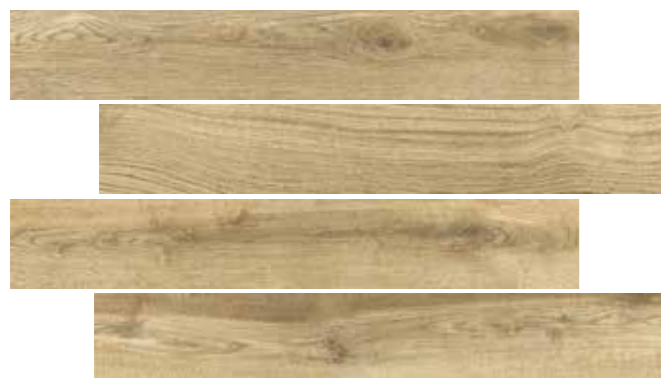
A51 0688240 Beige 14x84 . 6"x33"