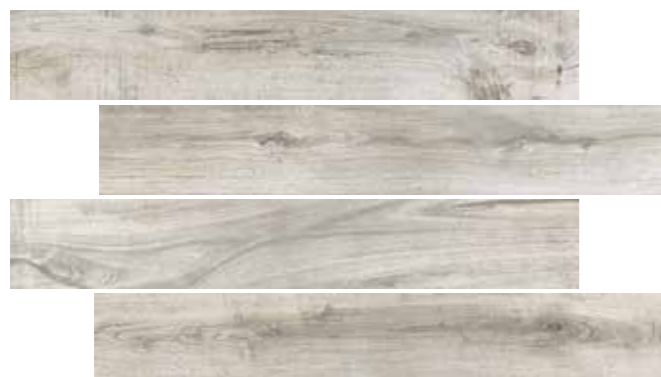
A51 0688270 Grey 14x84 . 6"x33"