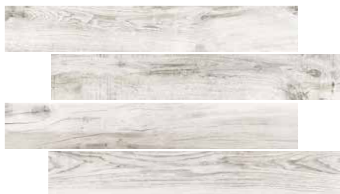
A51 0688205 White 14x84 . 6"x33"