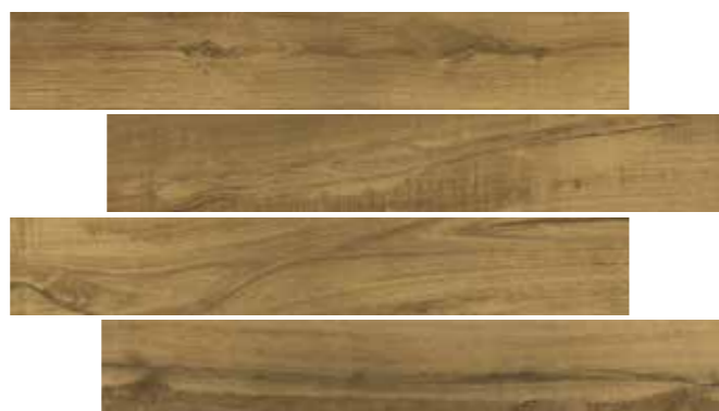
A51 0688260 Nut 14x84 . 6"x33"